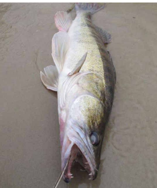
Фото с судаком.