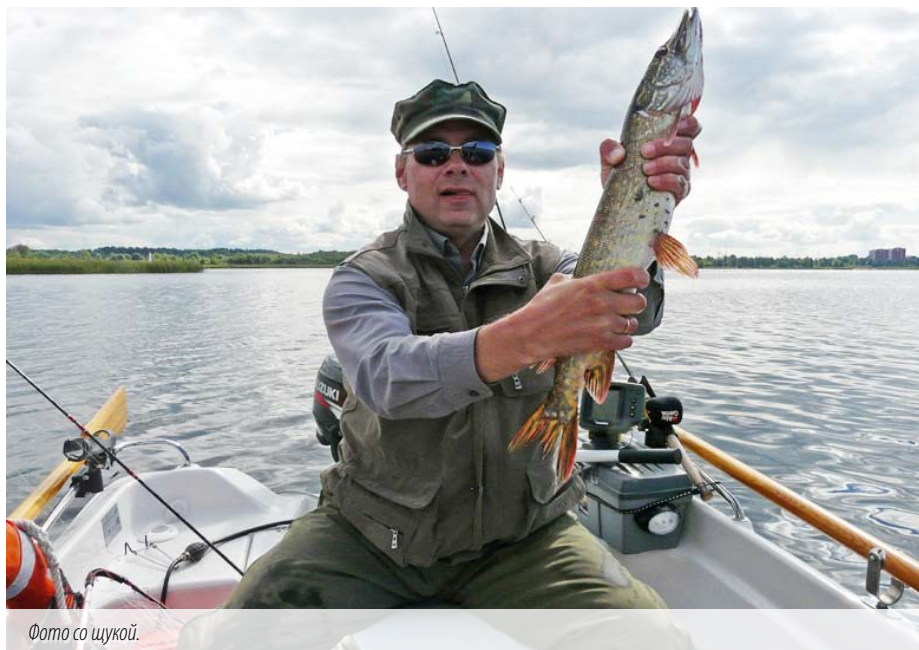
Фото со щукой.

но для рыболовов-любителей – не больше 5 кг.