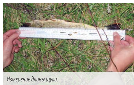
Измерение длины щуки.

меня несколько удивила. Так, например, щуку можно забрать, только начиная с 50-сантиметрового размера. А ведь при этом она весит уже в районе килограмма! То же самое касается и судака и жереха: их можно оставлять в улове, только начиная с длины 45 см. Надо признать, довольно гуманные правила по отношению к рыбе! Для сравнения – в Беларуси щука считается «легальной» от 35 см, жерех – от 34 см, а судак – от 40. Правда, в Латвии длина рыб всех видов определяется измерением расстояния от начала головы до окончания хвостового плавника, тогда как белорусская рыба меряется без хвоста.