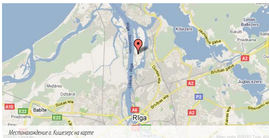
Местонахождение о. Кишезерс на карте

Введенные ограничения на допустимый размер рыбы будут действовать и на чемпионате мира. Существуют в Латвии ограничения и на количественный вылов рыбы. Из интересующих нас видов, которые ловятся на спиннинг, щуку и судака можно забирать по 5 штук. В пресноводных водоемах нет ограничений на окуня – его можно ловить любого размера,